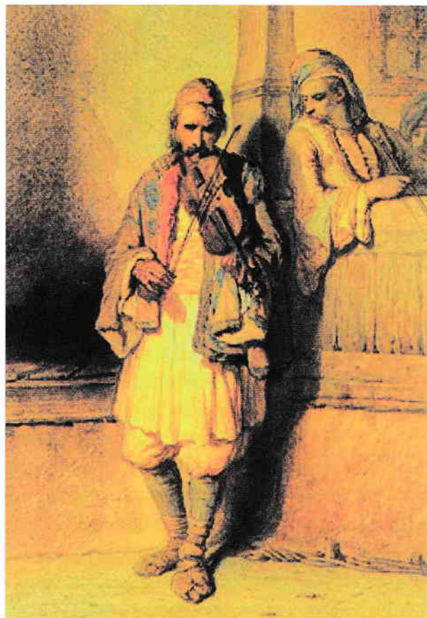
Violonistul , reproducere după Theodore Valerio

MUZICĂ ȘI ELIXIRE ECOUL UNEI PASIUNI ATRACȚIE MEDICALĂ