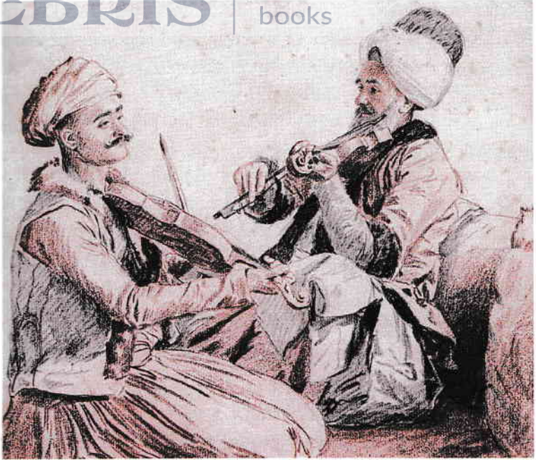
Doi lăutari, prelucrare după Jean-Étienne Liotard

lua durerea cu mâna și cu șase „sticle“ micuțe cât pumnul, pe care sclifosiții orașului, care se pretindeau greci, le numeau și ventuze .