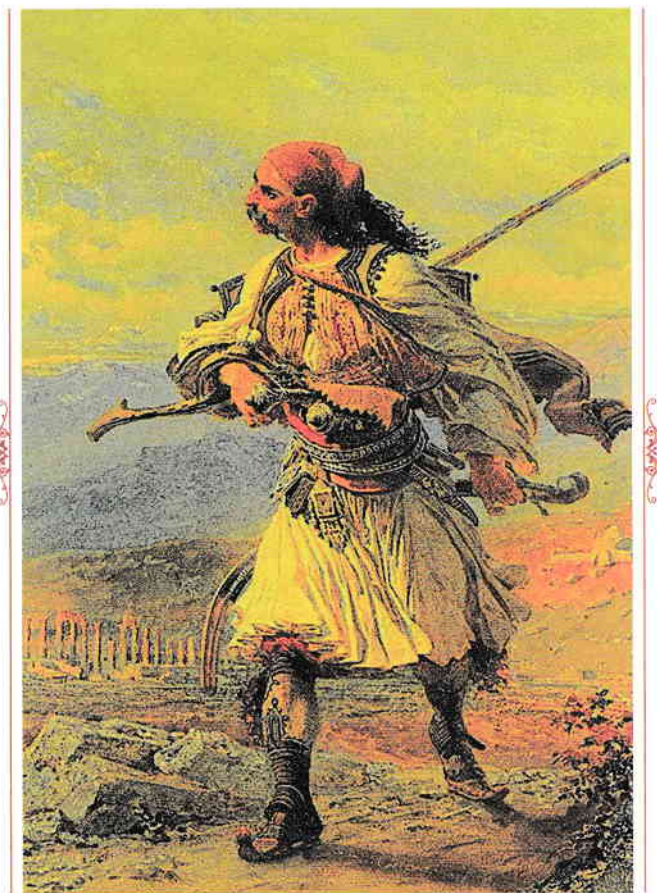
Arnăuț, Amedeo Preziosi